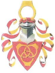
Sormusten sukuseura ry